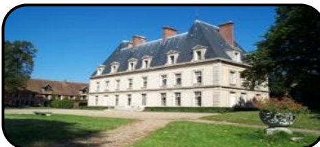
Le Château de Marines

Départ : Les Ecuries des Acacias Parc du Château – Route de Us 95640 MARINES